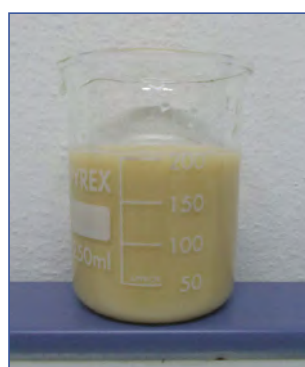
CEREALSPRINTER® in soluzione con 500g di Zolfo bagnabile