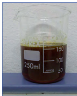
CEREALSPRINTER® tal quale

Può essere miscelato anche con sali idrosolubili qualora si intenda inserirlo all'interno di un programma nutrizionale più completo.