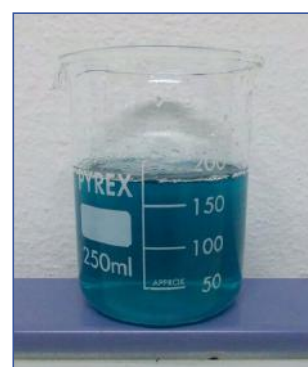
CEREALSPRINTER® in soluzione con 1kg di Solfato di Rame